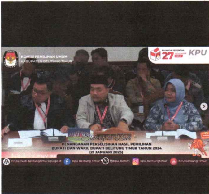
kpu_belitungtimur kpu_belitungtimur #TerimaPerintah Selasa, 21 Januari 2025 KPU Kabupaten Belitung Timur mengikuti sidang penyampaian jawaban termohon, keterangan pihak terkait dan penyampaian alat bukti perselisihan hasil pemilihan bupati dan wakil bupati belitung timur tahun 2024 ke Mahkamah Konstitusi RI. #KPU_Melayani #PikadaSerentak2024 IG: kpu_belitungtimur Website: https://kab-belitungtimur.kpu.go.id Facebook: KPU Belitung Timur Youtube: KPU Belitung Timur X: @kpu_belit 15w · See translation

Liked by nurasri1881 and 29 others January 22