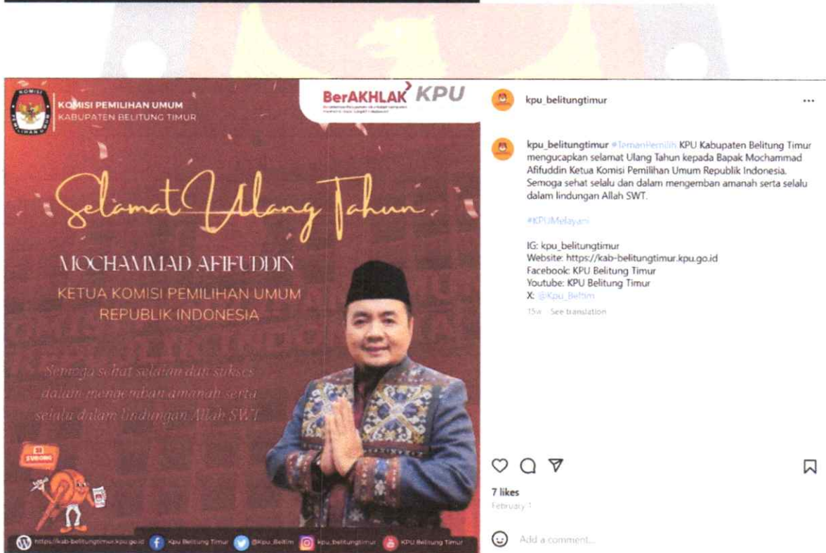
kpu_belitungtimur kpu_belitungtimur #TemanPemilih KPU Kabupaten Belitung Timur mengucapkan selamat Ulang Tahun kepada Bapak Mochammad Afifuddin Ketua Komisi Pemilihan Umum Republik Indonesia. Semoga sehat selalu dan dalam mengemban amanah serta selalu dalam lindungan Allah SWT. #KPU_Melayani IG: kpu_belitungtimur Website: https://kab-belitungtimur.kpu.go.id Facebook: KPU Belitung Timur Youtube: KPU Belitung Timur X: @Kpu_Belitim 15w · See translation

Liked by nurasri1881 and 60 others January 21 Add a comment