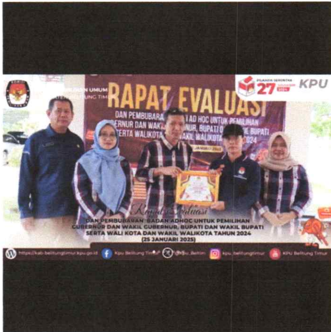
kpu_belitungtimur kpu_belitungtimur #TemanPemilih Sabtu, 22 Januari 2025 KPU Kabupaten Belitung Timur melaksanakan kegiatan rapat evaluasi dan pembubaran Badan Adhoc untuk pemilihan Gubernur dan Wakil Gubernur, Bupati dan Wakil Bupati serta Walikota dan Wakil Walikota Tahun 2024. #KPU_Melayani #PikadaSerentak2024 IG: kpu_belitungtimur Website: https://kab-belitungtimur.kpu.go.id Facebook: KPU Belitung Timur Youtube: KPU Belitung Timur X: @Kpu_Belitim 15w · See translation

Liked by nurasri1881 and 60 others January 21 Add a comment